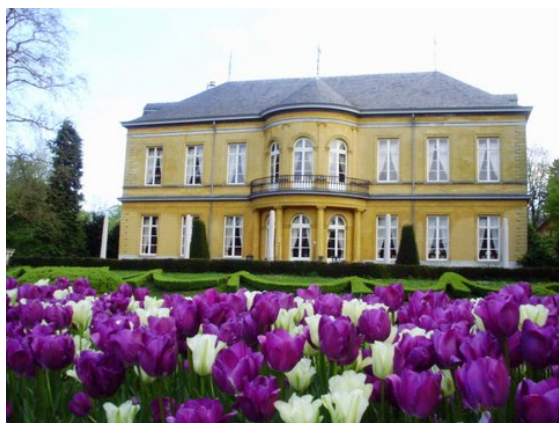
De parkzijde van Kasteel Oost te Valkenburg

In 1945 werden in Limburg 22 kastelen en adellijke landgoederen als Duits ‘vijandelijk vermogen’ door de Nederlandse Staat geconfisqueerd. Van Gennep tot Mheer betekende dat een dramatische breuk in de vaak eeuwenoude eigenaars- en familiegeschiedenis. Voor de voormalige eigenaren was het mogelijk tegen de bezitsvervreemding in beroep te gaan. Deze dienden zich in een ontvijandingsprocedure te laten ‘ontvijanden’, hetgeen een liquidatie van het vermogen niet in de weg stond.