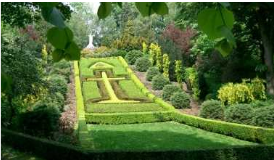
De fraai aangelegde kloostertuinen