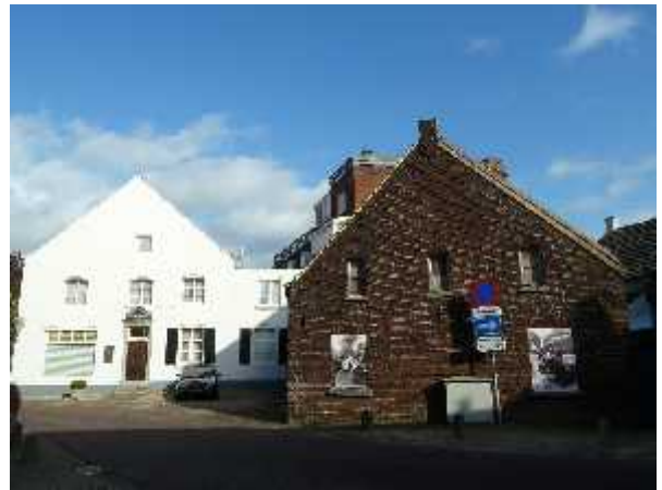
Huis de Gouden Berg